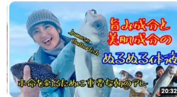
第10話“魚の宝庫 浦島グリの超絶品魚” 434 回視聴・3 週間前